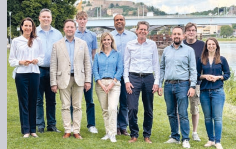
Der neu gewählte Vorstand des CDU-Ortsverbandes Süd / Stolzenfels in den Rheinanlagen mit Blick auf die Festung Ehrenbreitstein.

Ende Mai wurde im Hotel Kleiner Riesen der Vorstand neu gewählt. Der Ortsverband umfasst die Stadtteile Südliche Vorstadt, Oberwerth und Stolzenfels