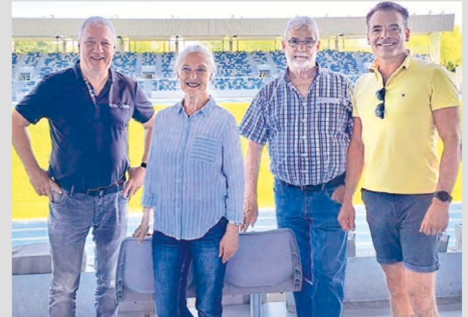
Für die CDU ist klar: Die Modernisierung soll den Anforderungen der Zukunft gerecht werden, gleichzeitig aber finanziell verantwortbar bleiben.

Von großer Bedeutung ist aus Sicht der CDU-Fraktion zudem die konsequente Nutzung möglicher Förderprogramme. Öffentliche Fördermittel können einen wichtigen Beitrag dazu leisten, die finanzielle Bela-