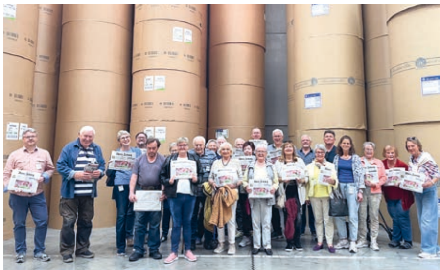
Vor den riesigen Papierrollen wirken die Gäste fast winzig: Im Druckhaus der Rhein-Zeitung erlebte die Gruppe, wie die Heimat-Lektüre auf den Frühstückstisch kommt.