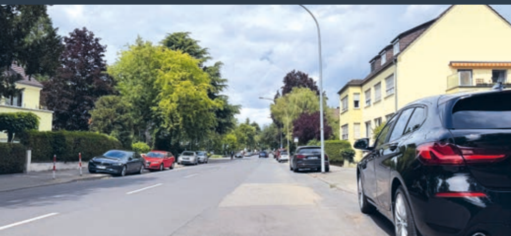
Die Mainzer Straße in der Südlichen Vorstadt: Der CDU-Ortsverband Süd fordert bei den geplanten Umbaumaßnahmen eine ausgewogene Lösung, die die Bedürfnisse aller Verkehrsteilnehmer sowie die angespannte Parkplatzsituation im Quartier berücksichtigt.